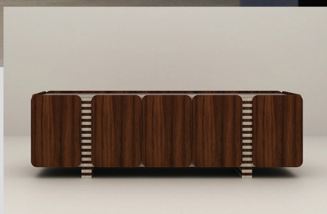
NOGUEIRA + CARVALHO