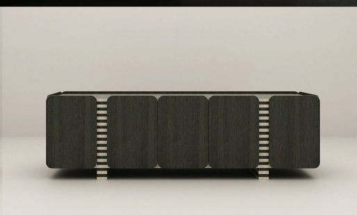
ÉBANO + CARVALHO