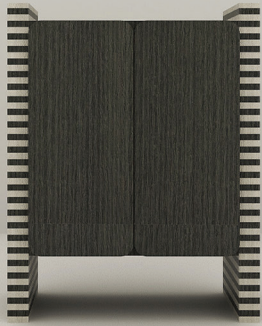
ÉBANO + CARVALHO