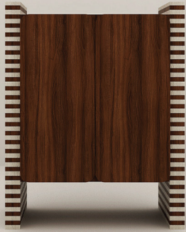
NOGUEIRA + CARVALHO