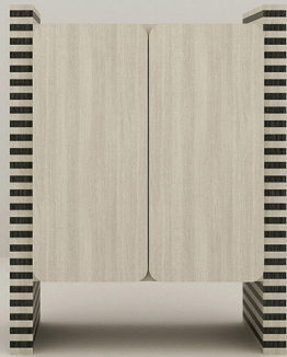
CARVALHO + ÉBANO