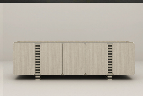
CARVALHO + ÉBANO